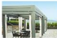
Gucci Café The Mall, Via Europa 8, Leccio